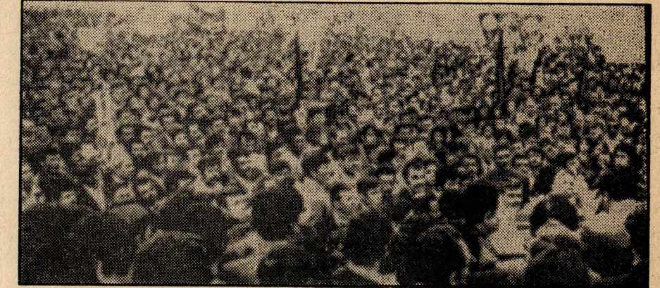
Tekstil işçileri İzmir'deki mitingde lokavtları protesto ettiler

Tekstil sanayiindeki hızlı büyüme, devletin teşvik imkânlarının yanında esas olarak bu iş ko-