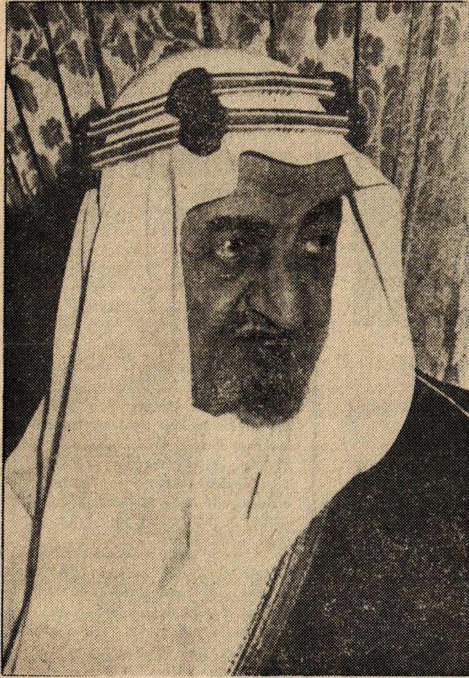
Resimde geçen hafta öldürülen emperyalizmin Ortadoğudaki silahlı muhafızı Kral Faysal görülüyor.

İşte bu durum, AP'yi diğer sermaye partilerine karşı çok yönlü bir mücadeleye itti. AP'nin